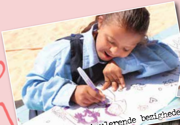
Creatieve en stimulerende bezigheden